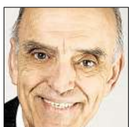
P. Kiesinger (CDU)